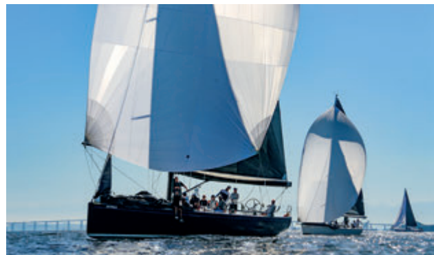
Sorsa - Segundo lugar na VPRS e fita-azul na Regata Comandante Érico