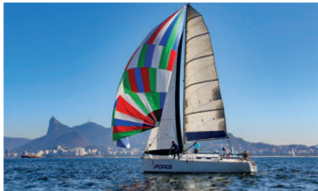
F Cinco - Vencedor na Cruzeiro B