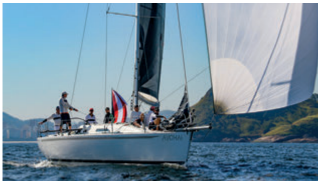
Avohai - terceiro lugar na VPRS