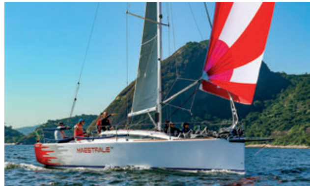
Maestrale 4 - Vencedor na VPRS

O veleiro Sorsa conquistou ainda o título de “Fita-Azul” da Regata Comandante Érico. Os resultados do circuito também foram válidos para o Estadual das classes BRA RGS e VPRS.