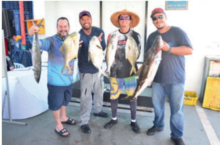
Mar Del Sol - Vencedora na 1ª etapa

A Pesca agradece especialmente ao Estaleiro Garnet pela parceria e anuncia que a segunda e decisiva etapa do torneio está prevista para o próximo dia 6 de agosto.