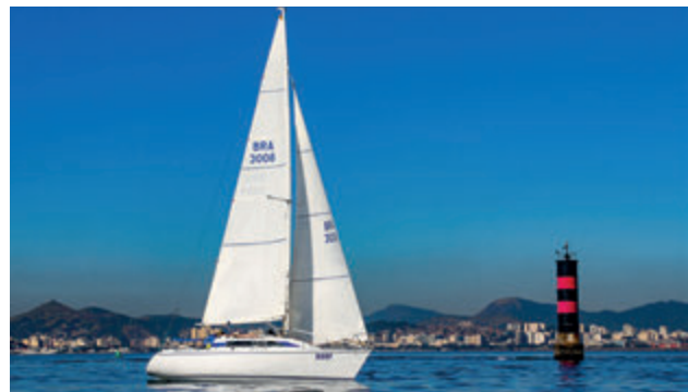
Dorf - terceiro lugar na RGS