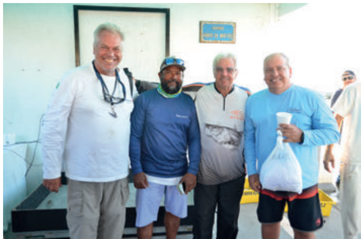
Release - Segundo lugar na 1ª etapa