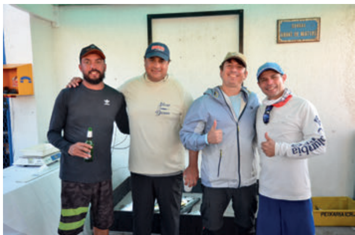
Luna Blu/Malta - Terceiro lugar na 1ª etapa