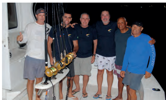
Equipe Picante - 3º lugar no Torneio de Abertura