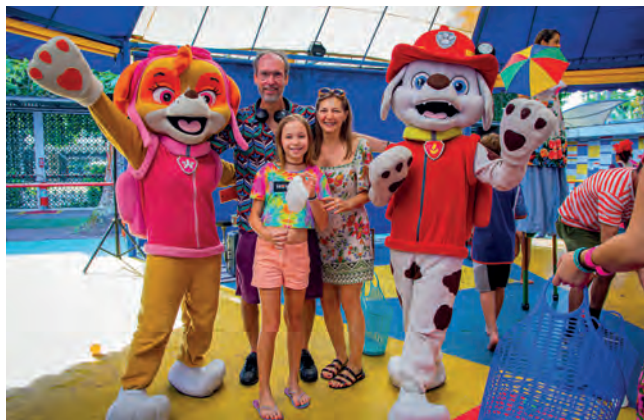
Patrulha Canina fez sucesso com o público