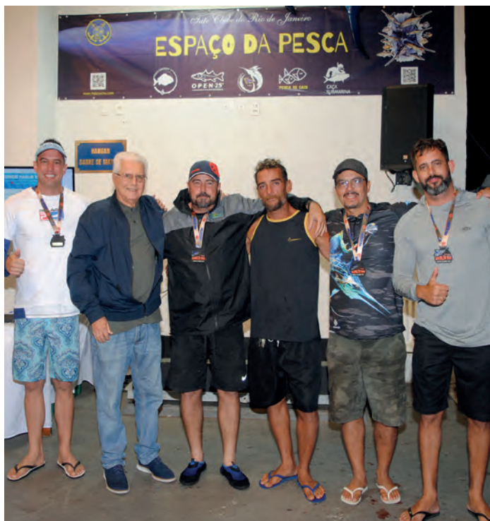
Equipe Cocoroca - 1º lugar no Torneio de Abertura e 1ª etapa do 27º Marlin Rio