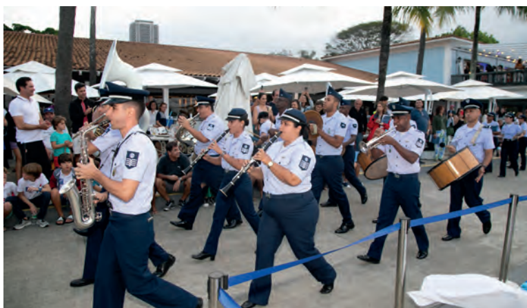
Banda Musical da Força Aérea Brasileira

O Campeonato Estadual de Optimist 2023 foi organizado pelo late Clube do Rio de Janeiro, com o patrocínio da Seguradora Smart Protect, e o apoio da Federação de Vela do Rio de Janeiro, além das empresas 2Sport, Ocean Blue e Outback.