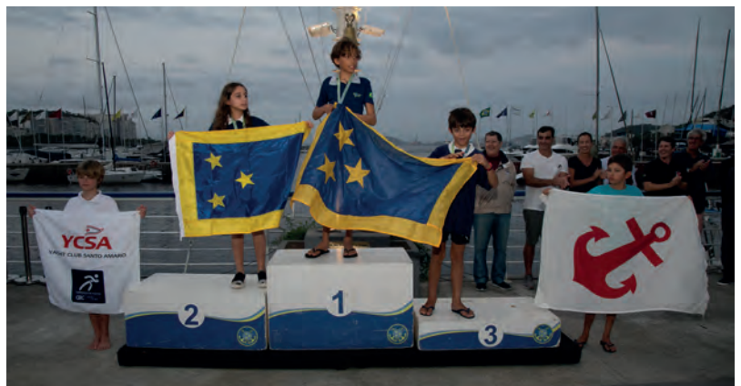
Pódio dos Estreantes na classificação geral