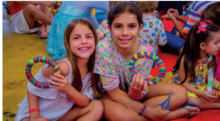
Para criança de todas as idades