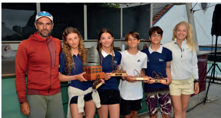
Equipe ICRJ 2 - Campeã