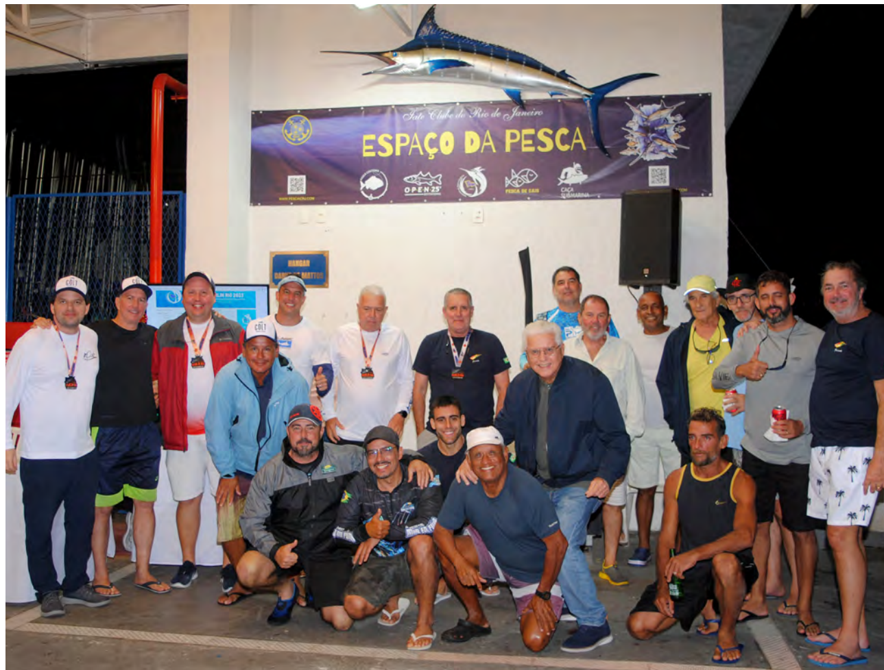
Pescadores em confraternização após o torneio no hangar 3

A equipe venceu o Torneio de Abertura e 1ª etapa do Marlin Rio