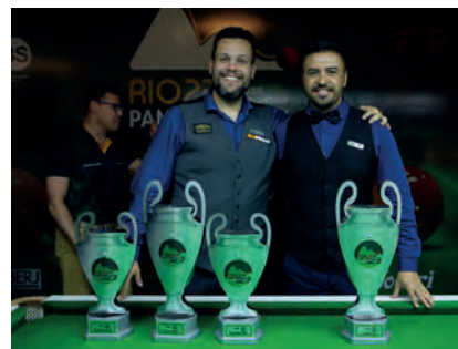
Evento realizado na Salão Marlin Azul com jogadores de diversas nacionalidades