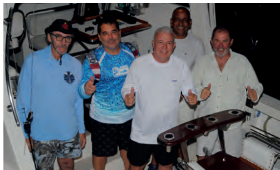
Equipe Clarabina - 2º lugar no Torneio de Abertura