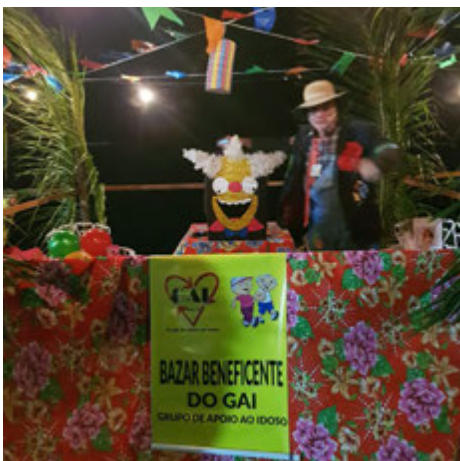
Barracas tiveram fundo solidário em prol de dois projetos sociais da região

O encontro arrecadou fundos em benefício do Grupo de Apoio ao Idoso e Projeto Pingo de Gente, localizados na região, e seguiu as medidas sanitárias impostas pela prefeitura de Cabo Frio.