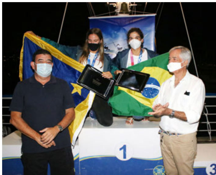
Comodoro e o Contra-comodoro entregam placas em homenagem ao Bicampeonato Olímpico

*O evento seguiu os protocolos sanitários estabelecidos pela Prefeitura do Rio.