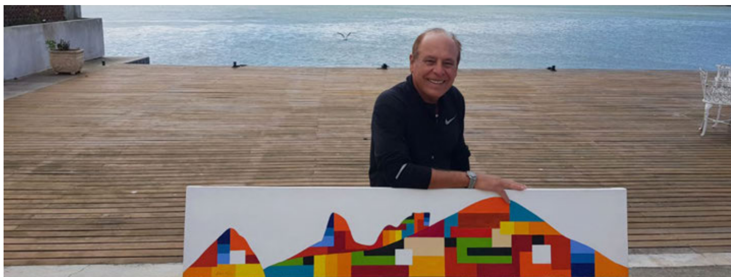
Roberto Pessôa é o artista responsável pela obra