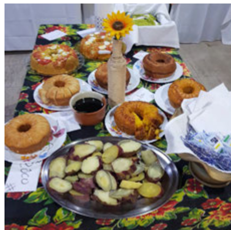
Buffet de comidas típicas