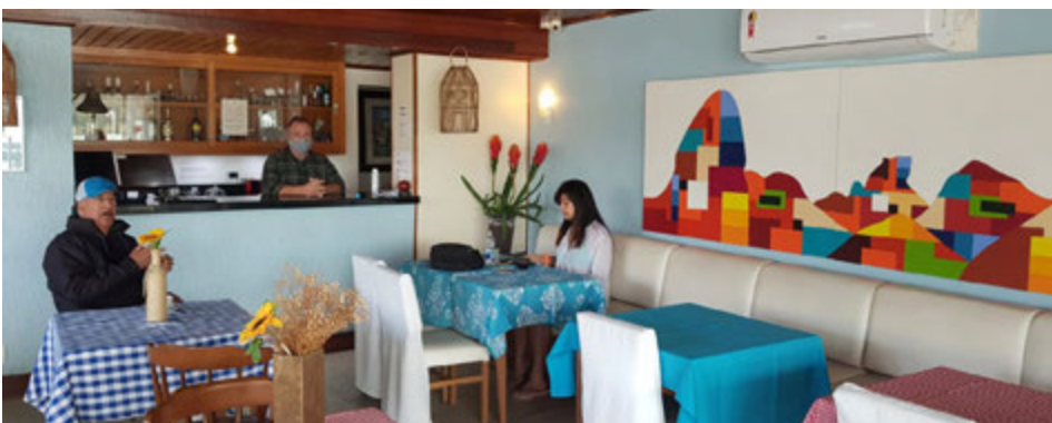
Restaurante da subsede de Cabo Frio expõe quadro da série A cor da cor

As peças do artista contemporâneo trazem alegria aos espaços e ficarão expostas no clube no mínimo por dois meses. Vale a visita em Cabo Frio para curtir a subsede e apreciar a mostra.